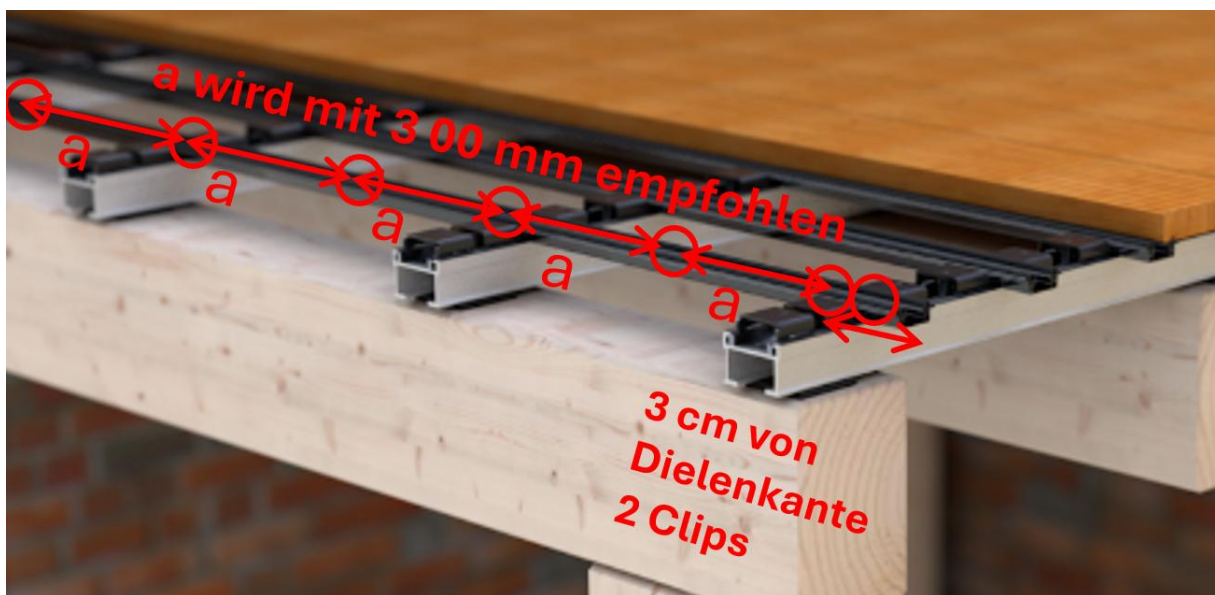
Abbildung 2: Zulässige Abstände Clips und Halter

Es sind immer 2 Clips am Ende der Alu-Schiene zu verwenden.